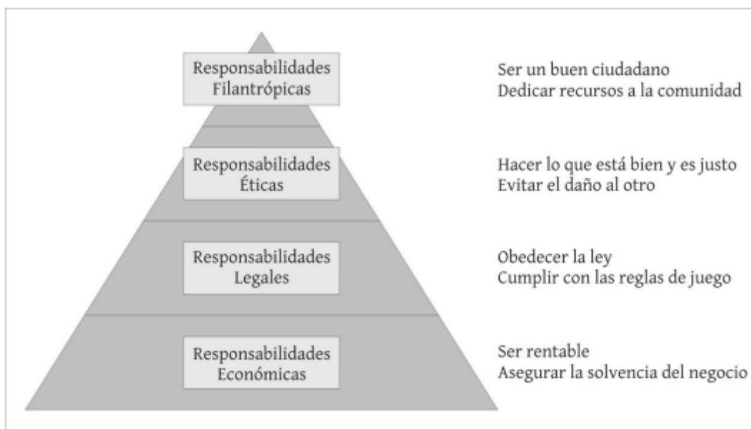
GRÁFICO. PIRÁMIDE DE LA RESPONSABILIDAD SOCIAL CORPORATIVA. CARROLL 1 . ADAPTACIÓN PROPIA.

desde la base a la cúspide; siendo las responsabilidades económicas de la empresa, asociadas al beneficio de los accionistas y directivos, el sustento de toda la estructura.